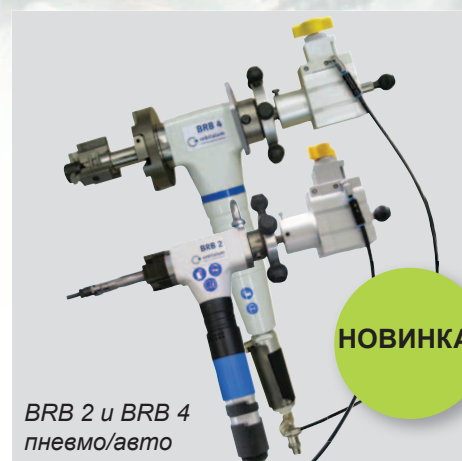
BRB 2 и BRB 4 пневмо/авто