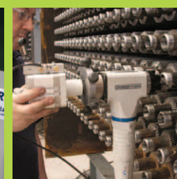
Максимальная мощность при малом весе.