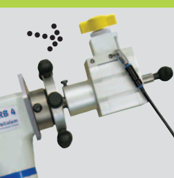
BRB пневмо/авто с пневматическим зажимом, идеален для серийной обработки!