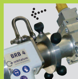
Крепление для сбалансированного манипулятора обеспечивает быструю и не требующую усилий обработку.