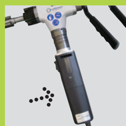
В будущем будут выпущены электромодели оптимизированного электродвигателя, а также станка BRB 2.