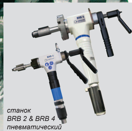
станок BRB 2 & BRB 4 пневматический