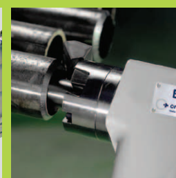
Точная и воспроизводимая подготовка швов соединений труб и трубных решеток.