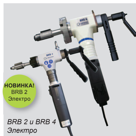
BRB 2 и BRB 4 Электро