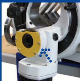
Дополнительное крепление пыльных полотен для отделения колен труб.