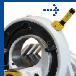
Встроенный лазер для маркировки мест обрезки.