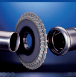
Прямоугольная и холодная обработка — идеальное решение для случаев применения пресс-фитингов!