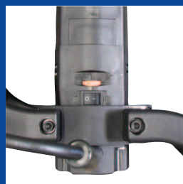
Мощный двигатель с защитой от перенапряжения и эргономичным дизайном ручек.