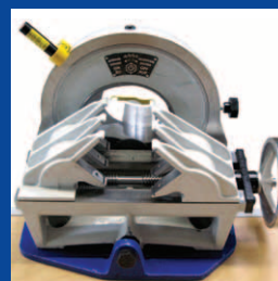
Скользящие зажимы из закаленного стального листа — опционально поставляются с зажимными головками из нержавеющей стали!